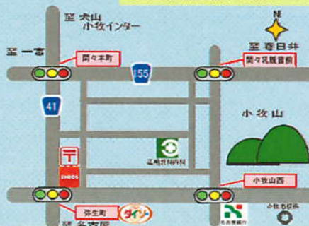
虹(江崎外科内科)の場所はココです

〒485-0047 小牧市曙町70 江崎外科内科2階 TEL 0568-75-2215(デイケア直通) 0568-75-2211(代表) FAX 0568-75-2600